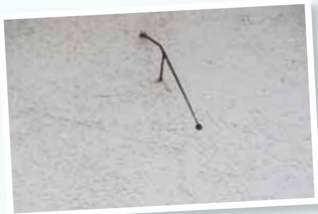
Le dernier vestige des cadrans solaires renageois

Des cadrans solaires à Renage ? Aujourd'hui ? Autant chercher midi à quatorze heures. La plupart ont disparu au gré du temps ou des ravalements de façades. A notre connaissance, il en subsiste un seul vestige, au 320 rue Créminési. En fait, il ne reste que le gnomon, la tige métallique qui sert à projeter son ombre sur le plan du cadran.