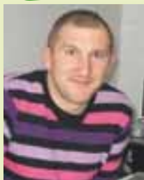
Directeur : Jean- Marc Bonsignore