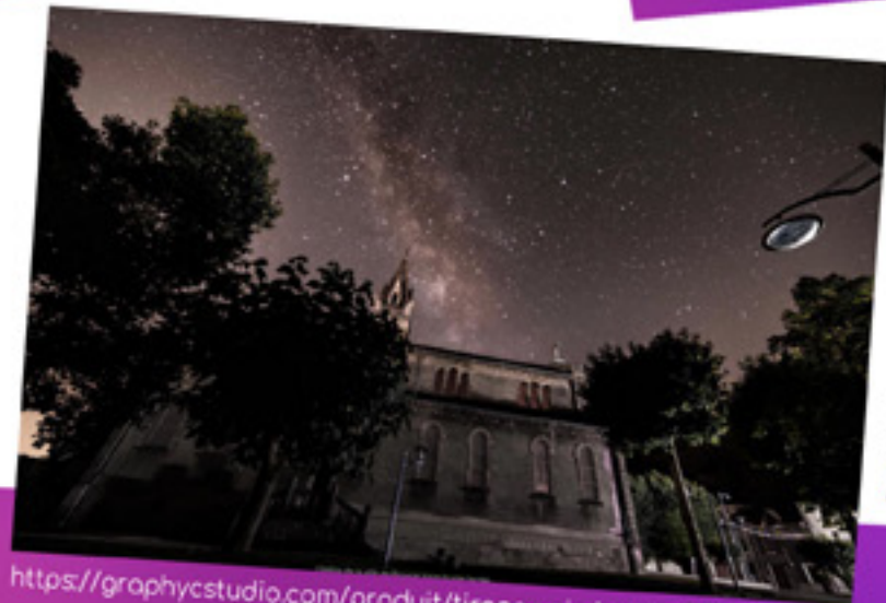
#CLICHÉ Sur le vif, l'église St Pierre de Vérone sous la nuit étoilée. Avril 2021

PARTAGEZ VOS PHOTOS #TALENTS Vous aussi, vous aimez photographier la ville de Renage, ses paysages, ses quartiers? N'hésitez pas à nous transmettre vos plus beaux clichés sur contact@ville-renage.fr