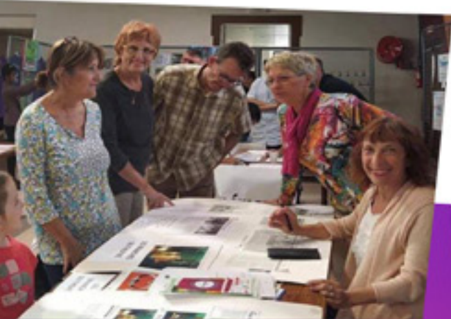
#FORUM DES ASSOCIATIONS Près de 40 associations et clubs contribuent au dynamisme local de Renage. Un grand merci à tous les bénévoles qui, tout au long de l'année, créent du lien et donnent de leur temps pour les autres. Septembre 2021