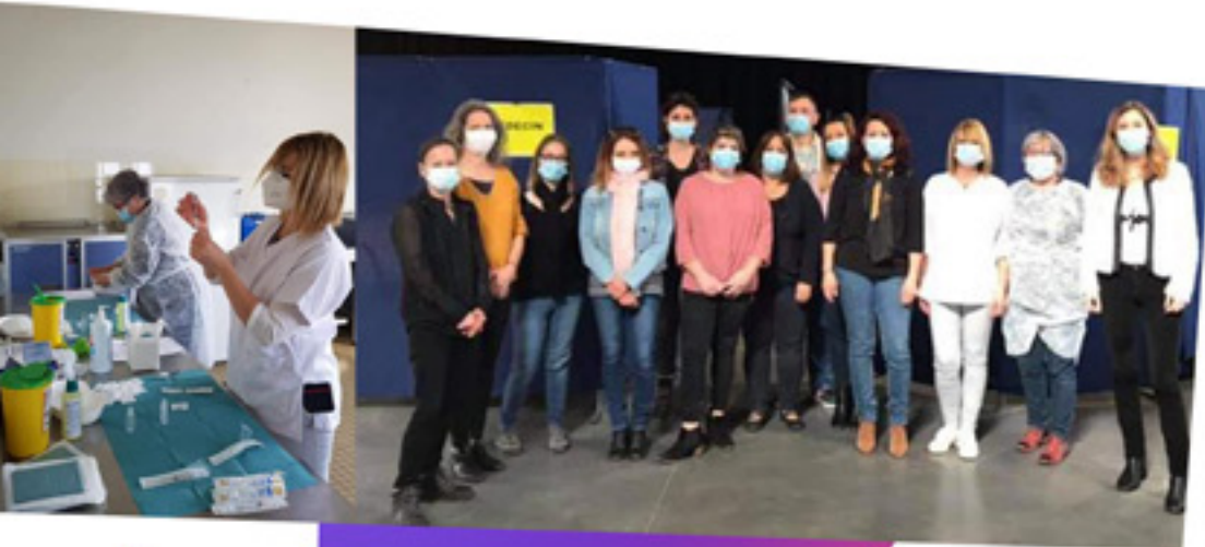
#VACCINATION À RENAGE Journées de vaccination organisées par la Commune de Renage, en lien avec l'Agence régionale de santé et les praticiens locaux pour contribuer, à notre niveau, à maîtriser l'impact de l'épidémie et protéger les plus fragiles. Mars à décembre 2021