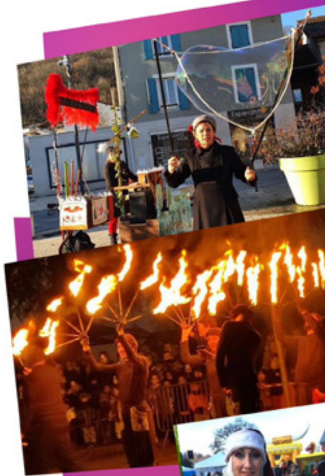
#DÉCEMBRE EN FÊTE Un mois de décembre au rythme des festivités pour faire vivre la magie de Noël et celle des fêtes de fin d'année! Décembre 2021