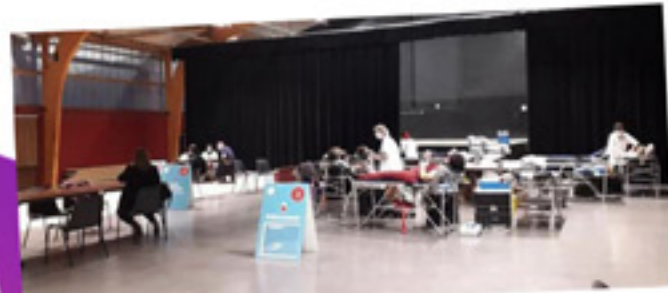
#DON DU SANG Collecte organisée par l'amicale des Donneurs de Sang de Renage. Ce geste de partage solidaire et citoyen a permis de récolter 50 dons. Novembre 2021