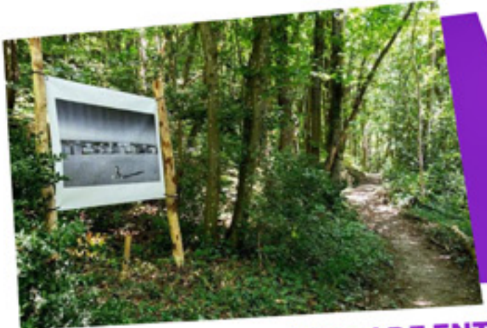
#BALADE ENTRE NATURE ET CULTURE De juillet à septembre, découverte de la très belle exposition de photographies « De sable et de vent » d'Hervé Combe, tout en se baladant sur le sentier du Sophora le long du Val de Fure. Été 2021