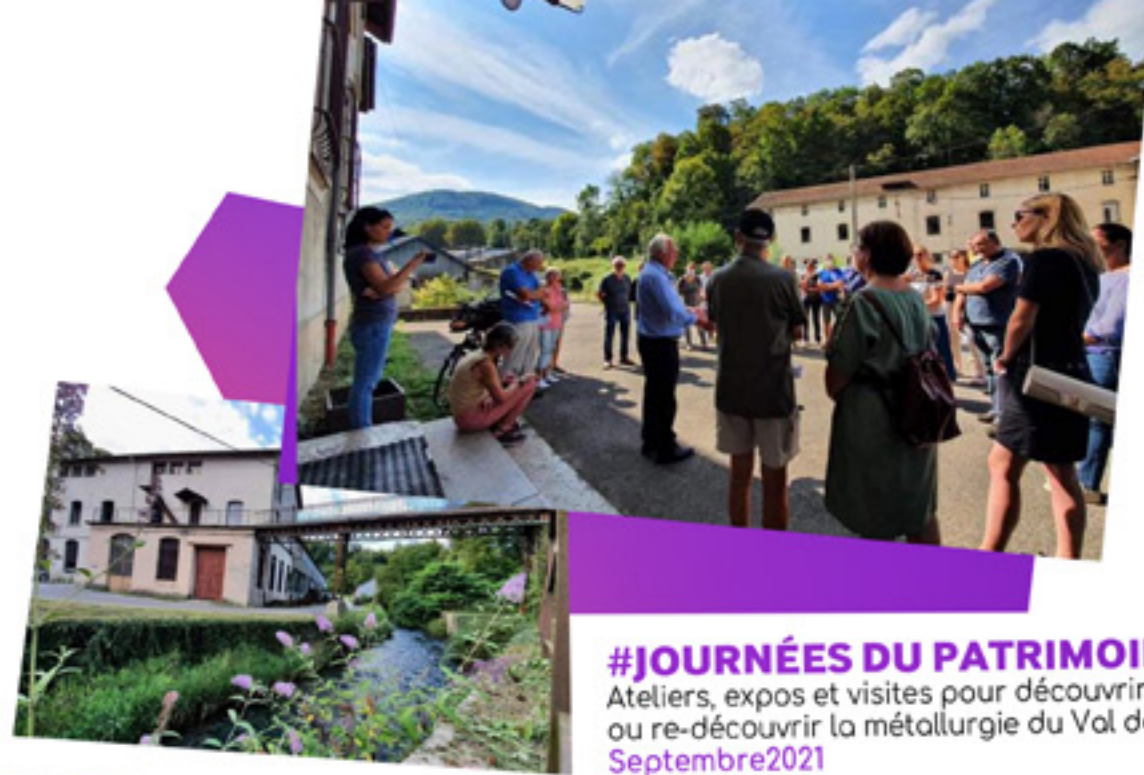
#JOURNÉES DU PATRIMOINE Ateliers, expos et visites pour découvrir ou re-découvrir la métallurgie du Val de Fure. Septembre 2021