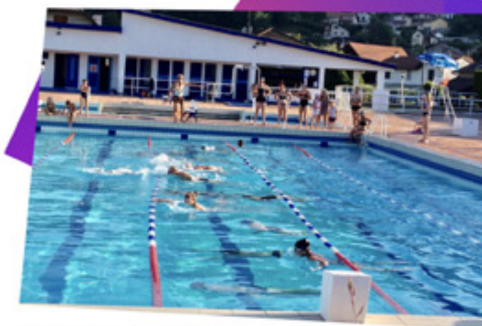
#TOUS À L'EAU! Comme chaque année, moments de détente et de rafraîchissement dans notre piscine municipale. Été 2021