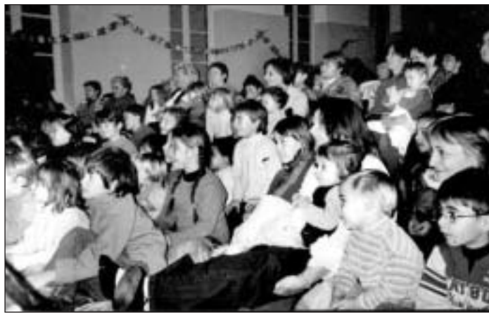
Spectacle " Piccolo et l'arbre magique ".

Par ces animations portées par le savoir-faire d'habitants bénévoles, toutes les composantes de la famille (parents, enfants, ados, grands-parents,