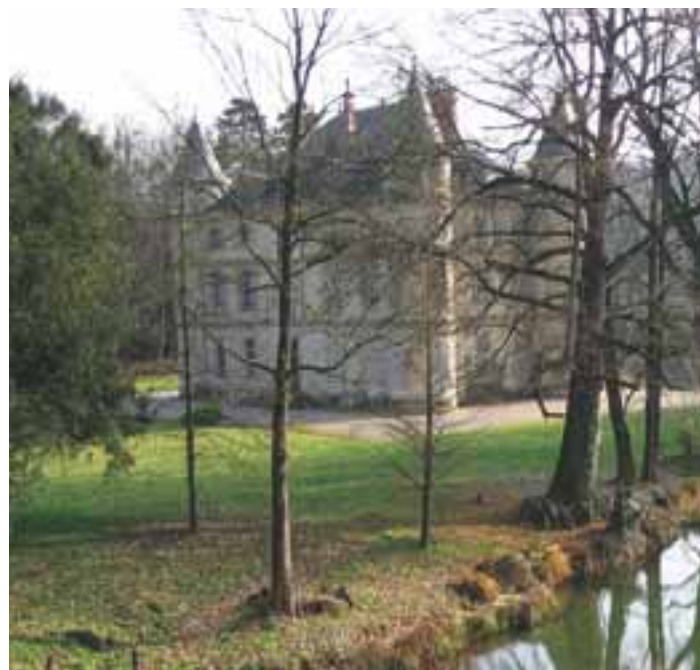
Le château d'Alivet.

Aujourd'hui ces vestiges industriels sont, il est vrai, peu majestueux mais ils sont pourtant une trace de la richesse qui a permis l'édification du prestigieux château de Renage. C'est en effet en 1848 que le propriétaire des forges, Charles de Mortillet, décide la construction d'un château moderne dans le parc même de l'ancien château d'Alivet (édifié en 1638 par Claude de Manissy). Le projet est ambitieux : un édifice d'une trentaine de pièces avec pas moins de 102 fenêtres, une toiture en ardoise d'Angers et quatre magnifiques tourelles d'angle. Il faudra plus de trois ans pour mener à bien