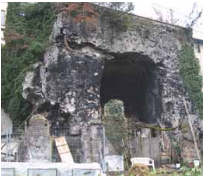
Le bas fourneau d'Alivet.

Aujourd'hui ces vestiges industriels sont, il est vrai, peu majestueux mais ils sont pourtant une trace de la richesse qui a permis l'édification du prestigieux château de Renage. C'est en effet en 1848 que le propriétaire des forges, Charles de Mortillet, décide la construction d'un château moderne dans le parc même de l'ancien château d'Alivet (édifié en 1638 par Claude de Manissy). Le projet est ambitieux : un édifice d'une trentaine de pièces avec pas moins de 102 fenêtres, une toiture en ardoise d'Angers et quatre magnifiques tourelles d'angle. Il faudra plus de trois ans pour mener à bien