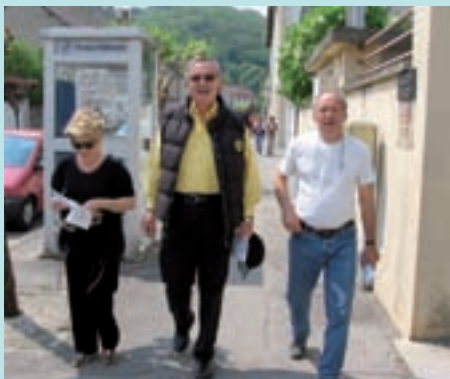
Monsieur le Maire aussi mène l'enquête...

Une belle journée en ce début mai et pas moins de 150 candidats pour le premier rallye pédestre organisé par l'équipe d'animation de la Mairie. Succès de participation mais aussi succès d'intérêt pour le patrimoine de la ville, le thème principal de cette petite randonnée. Les concurrents ont ainsi pu découvrir ou redécouvrir sur un parcours d'environ 5 kilomètres le château d'Alivet, la chapelle de la Grande Fabrique, la ferme Baudriller ou les vestiges d'un bas fourneau. Ils ont aussi joué le jeu en répondant à une trentaine de questions et en participant à des épreuves ludiques. A la fin de la promenade, RDV était donné à la Grande Fabrique pour récompenser les concurrents et boire un verre de l'amitié. Bref, le comité d'organisation a indiscutablement atteint son objectif : divertir tout en renouant avec le passé. Un grand merci donc aux nombreux concurrents du rallye, aux propriétaires qui ont ouvert les portes de leur domaine et à tous les commerçants locaux qui