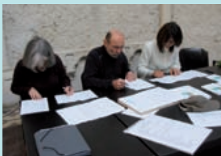
Le jury concentré sur la correction des questionnaires

ont permis de doter généreusement l'épreuve du premier au dernier participant. Ranzon du succès, un nouveau rendez-vous est déjà pris pour une prochaine édition.