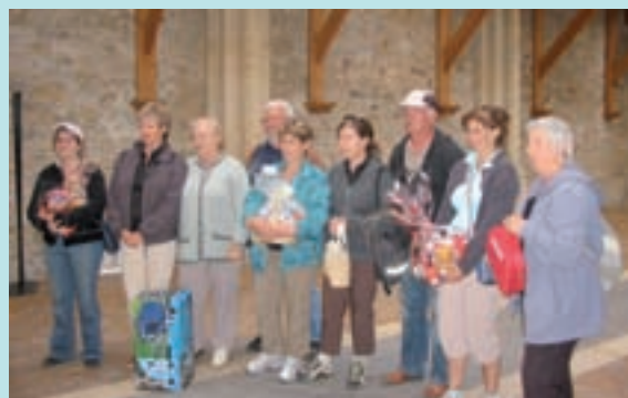
Les lauréats et leurs trophées

ont permis de doter généreusement l'épreuve du premier au dernier participant. Ranzon du succès, un nouveau rendez-vous est déjà pris pour une prochaine édition.